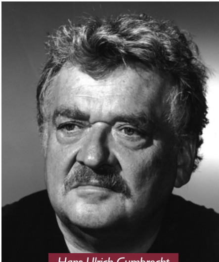
Hans Ulrich Gumbrecht

Dabei gibt es natürlich Funktionen der Bewahrung, die mit dem, was ich Verunsicherung nenne, zusammengehen. Um zum Beispiel die vorsokratischen Papyri und Texte verfügbar zu machen, braucht man Philologen, die diese Texte bewahren sowie die Kompetenz, diese zu verstehen. Das wäre sozusagen nicht im politischen, sondern im wörtlichen Sinne eine konservative Aufgabe. Gleichzeitig sind diese vorsokratischen Texte dertart verwirrend, dass sie immer, wenn sie in die Diskussion der Philosophie gekommen sind, auf produktive Weise zur Komplexifizierung der Welt beigetragen haben.