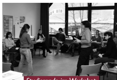
Studierende im Workshop

arbeit“ am ZAK wird erneut die Qualifizierung von engagierten Studierenden für ihre ehrenamtliche Arbeit in Hochschulgruppen gefördert.