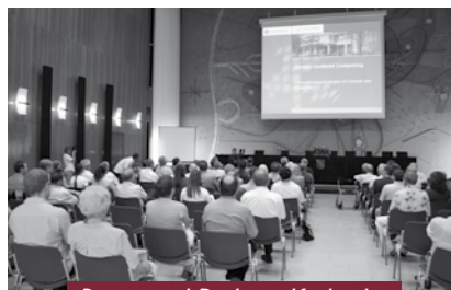
Bürgeraal Rathaus Karlsruhe