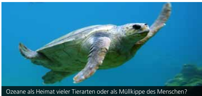
Ozeane als Heimat vieler Tierarten oder als Müllkippe des Menschen?