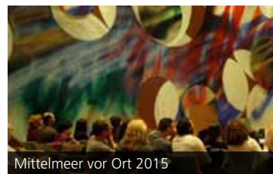
Mittelmeer vor Ort 2015

ruhe e.V. ausgewählte Kurzfilme junger israelischer Regisseurinnen und Regisseure gezeigt wurden. Die jungen Filmemacher sind Teil einer neuen israelischen Generation, ihre Kurzfilme greifen die Vielschichtigkeit der israelischen Gesellschaft