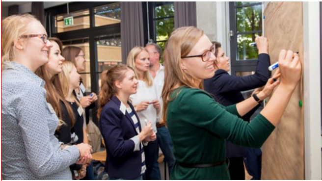
Teilnehmerinnen des Careerbuilding-Programms der Femtec